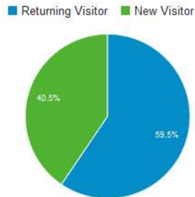
Figure 2 : Pourcentage de nouveaux et d'anciens visiteurs du portail Wikwio de janvier 2014 à juin 2016 Percentage of new and returning visitors of the portal Wikwio from January 2014 to June 2016

Les membres du portail sont des personnes susceptibles d'apporter leur contribution, soit en raison de leurs connaissances, documents techniques, photos sur les adventices qu'ils souhaitent partager, soit parce qu'ils souhaitent soumettre à la communauté des questions sur l'identification des espèces ou les pratiques de désherbage et contribuer ainsi aux échanges et à la dynamique d'acquisition de connaissance de la plateforme.