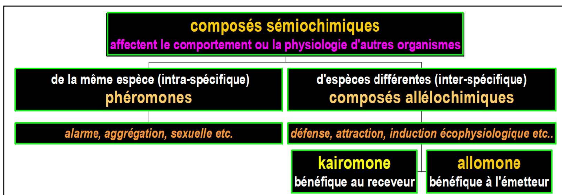
Figure 1 : définition des composés sémiachimiques/ Semiochemicals definition

- Entre espèces différentes, ce sont des relations interspécifiques qui mettent en jeu les molécules allélochimiques. Celles-ci ont été classées en deux grandes catégories, les allomones qui bénéficient à l'organisme émetteur, et les kairomones qui bénéficient à l'organisme receveur : par exemple dans le premier cas un répulsif qui éloigne l'insecte ravageur, ou dans le second la couleur d'une fleur qui attire les insectes pollinisateurs. Ces molécules allélochimiques interviennent aussi dans la communication des plantes entre elles: on parle alors d'allélopathie.