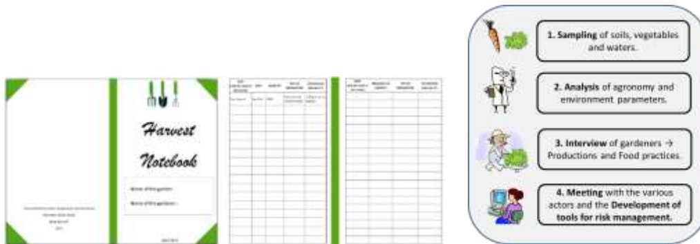
Figures 3 and 4 :

Carnets de récoltes (Pourias et al., 2015) et différentes étapes de l'étude. Notebooks crops (Pourias et al., 2015) and the various stages of the study.