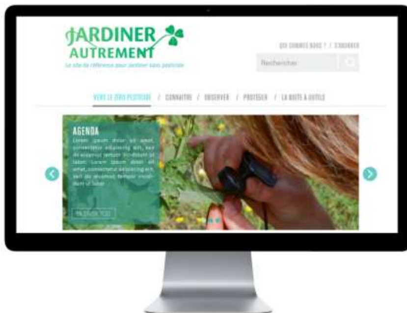
Figure 1: www.jardiner-autrement.fr new website's homepage.